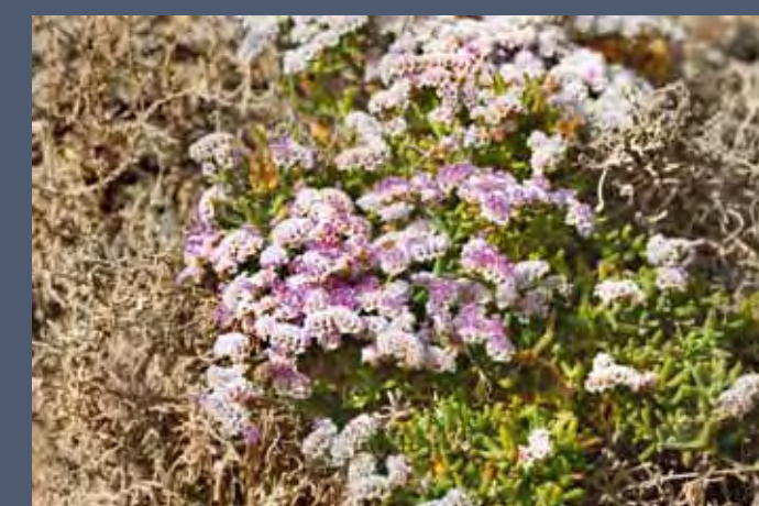
Siempreviva zig-zag ( Limonium papillatum ).