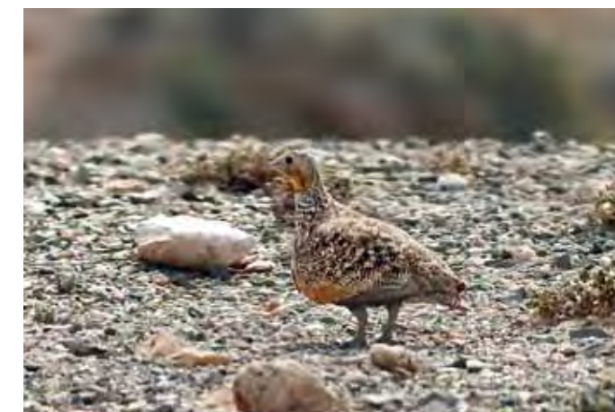
Ganga ortega ( Pterocles orientalis ), una de las aves esteparias más comunes dentro del campo militar de Pájara.

El halcón tagarote ha experimentado en Canarias un espectacular incremento poblacional desde los años 90 del pasado siglo hasta la actualidad, de manera que hoy en día ocupa todas las islas y los principales islotes y roques, y alcanza una población de alrededor de un centenar de parejas en el conjunto del archipiélago. Su dieta es, al igual que la del halcón peregrino, casi exclusivamente ornitófaga, siendo muy raro que deprede sobre otros vertebrados, mostrando una especial predilección por la paloma bravía o cimarrona. Se reproduce en acantilados costeros, islotes, grandes barrancos y montañas o roques interiores, aunque suele cazar también en otros ambientes, tales como llanuras terroso-pedregosas, jables arenosos e incluso cultivos y ciudades. Aunque su tendencia poblacional es positiva, está amenazado básicamente por las molestias en sus zonas de nidificación, el expolio de nidos para la práctica de la cetrería y la caza furtiva, así como también por el impacto con los tendidos eléctricos.