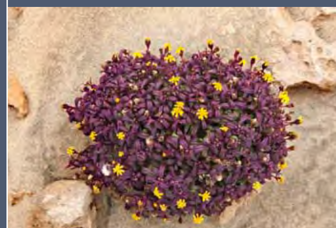
Senecio leucanthemifolius var. falcifolius es un endemismo canario-oriental que siempre crece muy cerca del mar.