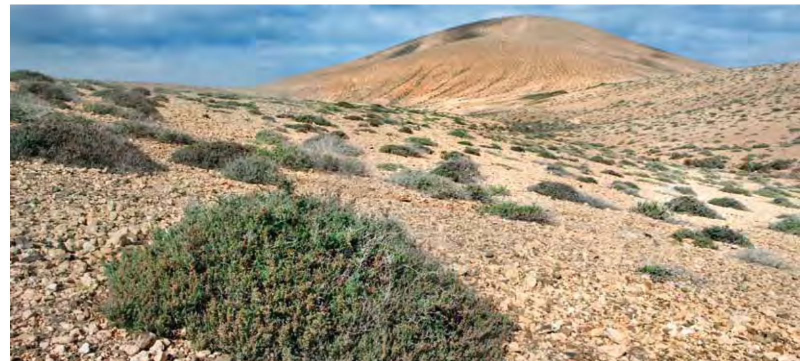
Vegetación de laderas pedregosas áridas dominada por Suaeda ifniensis .

Gran parte del campo militar está formado por áridas laderas con suelos de poca profundidad y frecuentes afloramientos rocosos. También pueden presentarse costras calcáreas originadas a partir de antiguos recubrimientos de arena. En estas áreas tan familiares en el paisaje mayorero se desarrolla generalmente un tipo de vegetación disperso formado por aulagas, espinos de mar, algahuera ( Chenoleoides tomentosa ) y matabruscas carambillas ( Salsola vermiculata ). Es el llamado matorral nitrófilo árido ( Chenoleoideo tomentosae-Salsoletum vermiculatae ). Su composición varía: en lugares con mucho aporte de nitrógeno, por ejemplo en las laderas donde se encuentran las colonias de gaviotas del campo militar, es más abundante la matabrusca carambilla y la aulaga, mientras que en áreas más llanas, con suelos arcillosos compactados y salinizados, predomina la algahuera. El matomoro