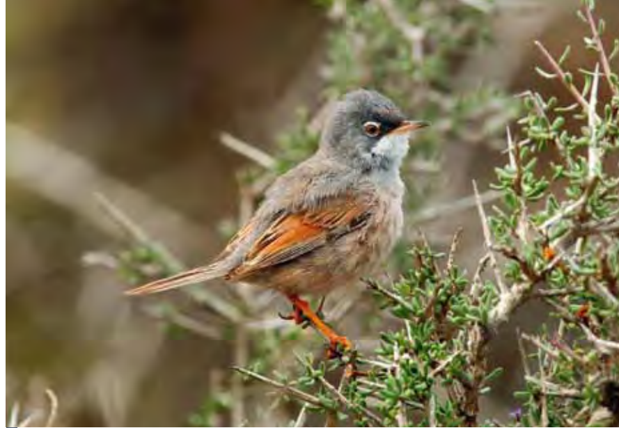
La curruca tomillera ( Sylvia conspicillata orbitalis ) es una de las dos especies de curruca presentes en el interior del campo militar. A diferencia de la cabecinegra ( Sylvia melanocephala leucogastra ), no está ligada a los “bosques-galería” de tarajales.