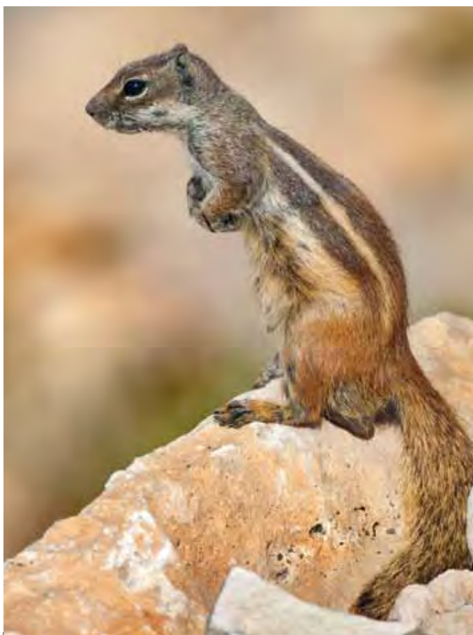
Ardilla moruna ( Atlantoxerus getulus ), roedor introducido de amplia distribución en la isla.

Al margen de las citadas especies, no se descarta la presencia de dos mamíferos autóctonos de la isla, la musaraña canaria ( Crocidura canariensis ) y el murciélago de borde claro ( Pipistrellus kuhlii ), ya que ambos han sido citados para zonas no muy alejadas del campo militar. El primero de ellos es además endémico de las islas e islotes orientales. En el caso del quiróptero, los enclaves más apropiados son los barrancos de Amanay y Vigocho.