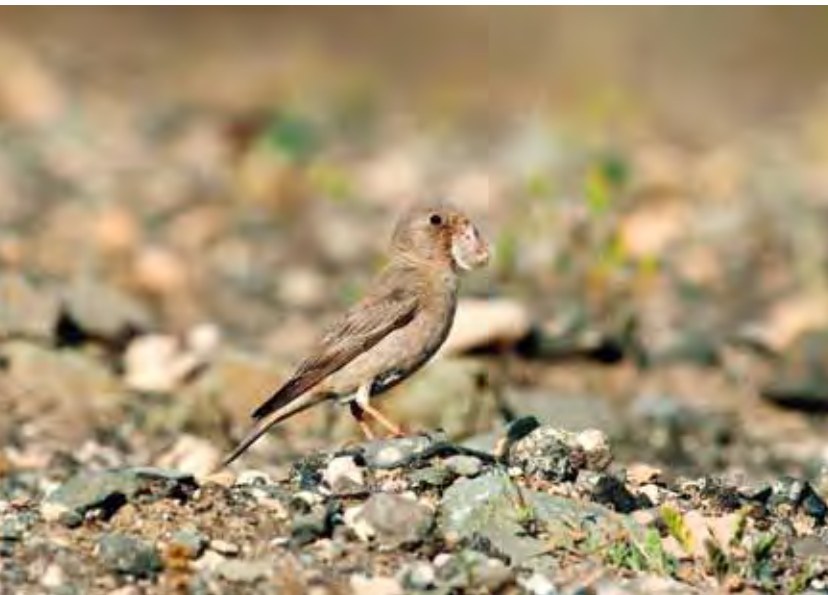
Camachuelo trompetero o "pispo" ( Bucanetes githagineus amantum ).