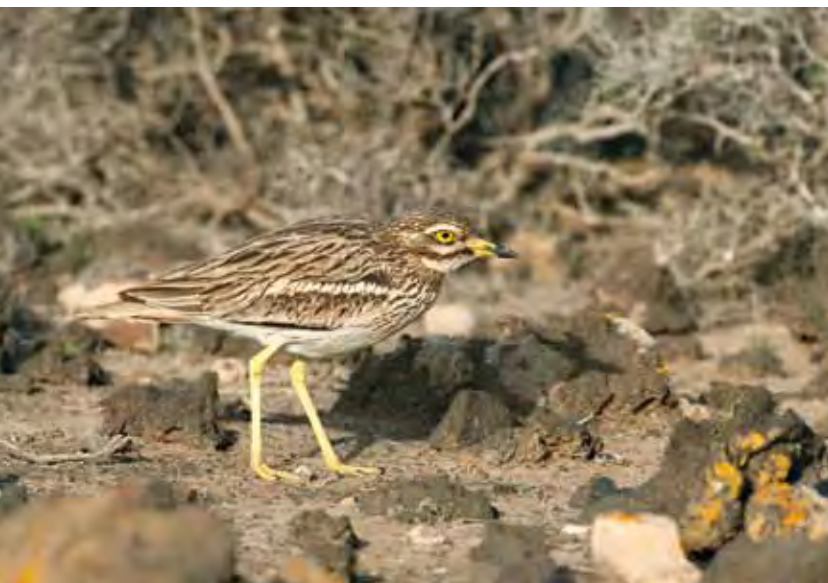
Alcaraván común o "pedro luis" ( Burhinus oedicnemus insularum ).