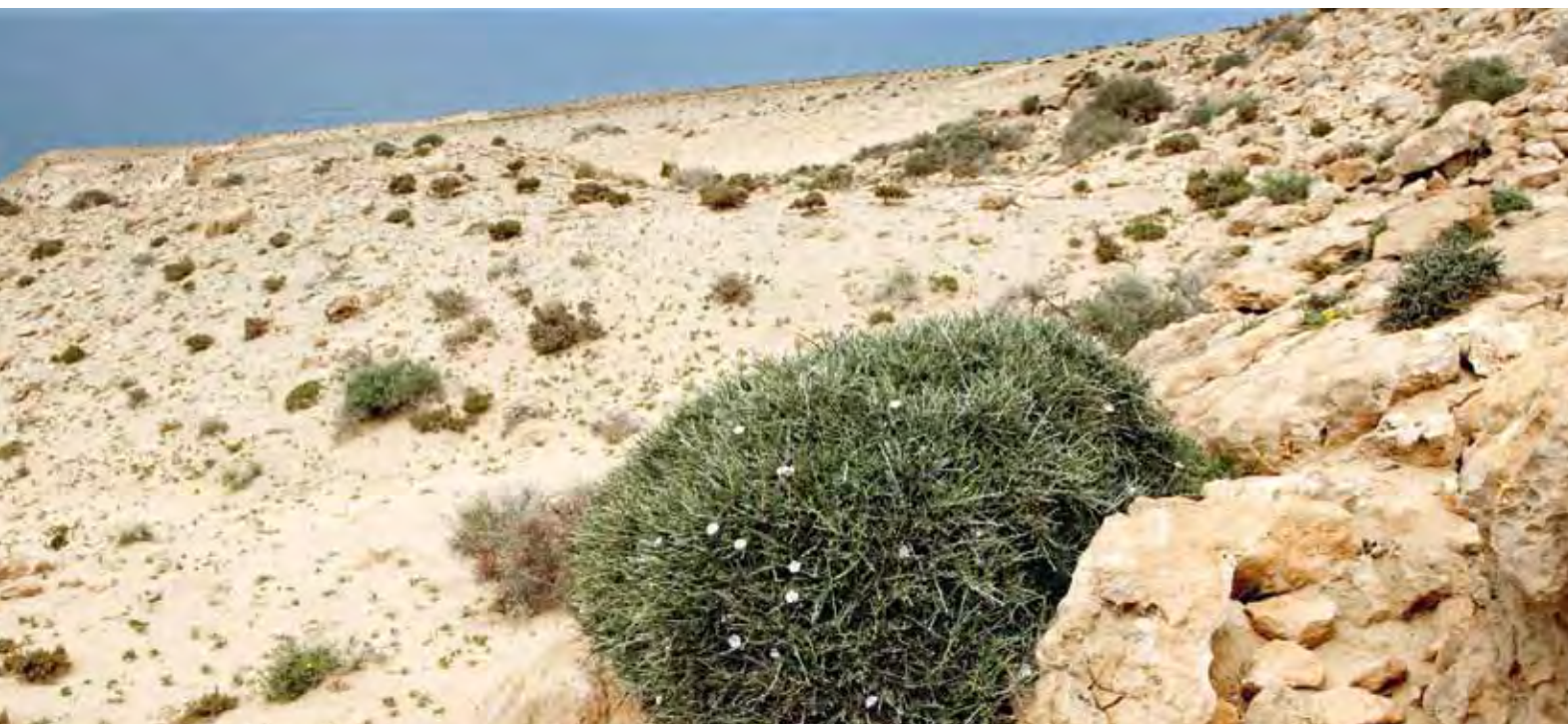
Las poblaciones de chaparro del campo militar de Vigocho son las más extensas conocidas para la especie.