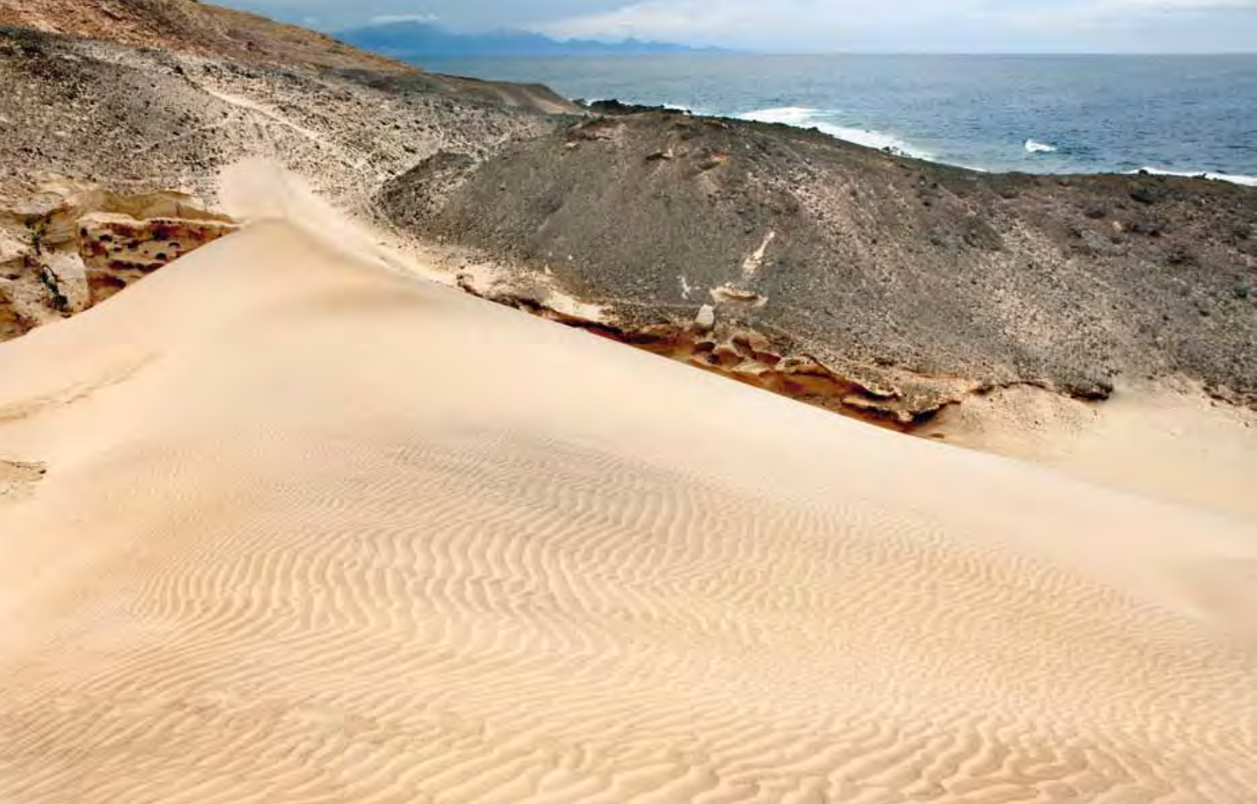
Solo la roca es capaz de detener las finas arenas anaranjadas de unas dunas permanentemente empujadas por el viento.

de arenas en el conocido como jable de Vigocho. Se trata de una excepcional formación mixta de dunas y aluviones torrenciales fósiles (con más de 10 m de espesor en algunas zonas), apoyada en una rasa marina elevada a 10 m y labrada sobre materiales del Complejo Basal.