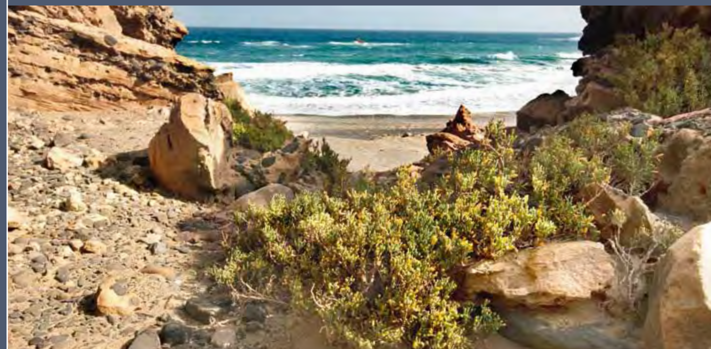
En el cinturón halófilo, la uvilla de mar ( Zygophyllum fontanesii ) puede crecer tanto sobre arena como en suelo rocoso.