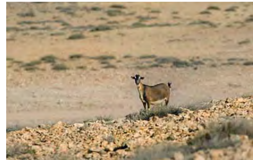
Arriba: Los viejos concheros evidencian el marisqueo tradicional. Abajo: Las cabras “de costa” pastan semisalvajes.

desarrolló la conocida como “ganadería de costa”, donde las cabras pastan en estado semisalvaje, para ser periódicamente recogidas a modo de rodeos caprinos en unos grandes corrales redondos de piedra denominados con el nombre tradicional de “gambuesas”. Una de estas estructuras de origen prehistórico sigue todavía en uso en las inmediaciones de lomo Cumplido, en el límite del campo de tiro. También puede verse otra junto al cauce del barranco de Amanay, actualmente destruida en parte por los efectos, siempre torrenciales en esta zona, de las lluvias.