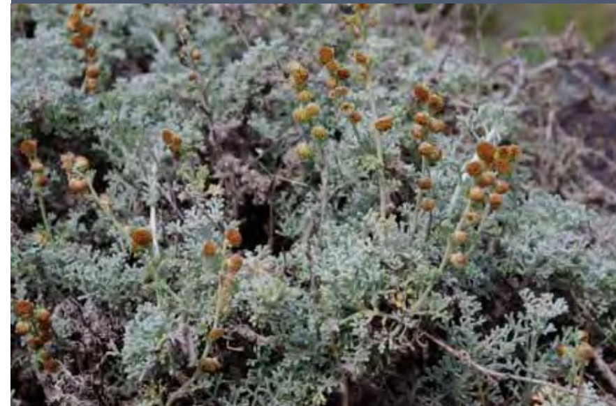
Amulei ( Artemisia reptans ), planta rastrera muy localizada en Fuerteventura, cuyas mayores poblaciones se sitúan en el jable del istmo de la Pared (Jandía).

Sin embargo, lo que hace especial a la comunidad arbustiva del jable de Vigocho es la alta participación en ella del chaparro canario ( Convolvulus caput-medusae ), un endemismo de Fuerteventura y Gran Canaria, que tiene dentro de