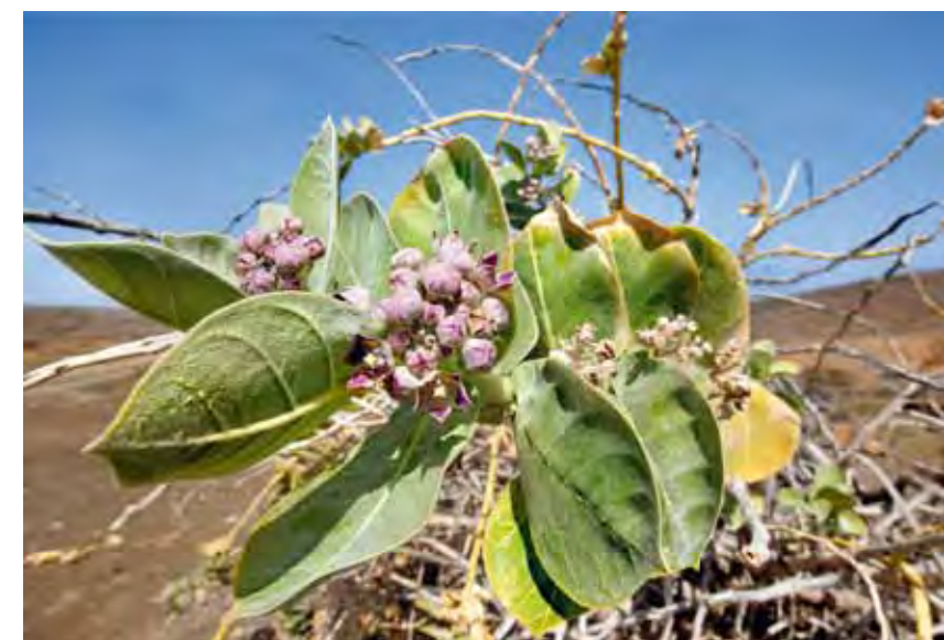
Árbol de la seda ( Calotropis procera ).

La especie se desarrolla casi exclusivamente en el fondo de valles y barrancos, subiendo a veces un poco por las laderas próximas, aunque buscando siempre vaguadas y barranquillos que le proporcionen humedad durante una parte del año.