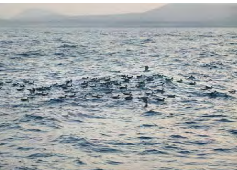
Balsa de pardela cenicienta ( Calonectris diomedea borealis ).

La pardela cenicienta se observa en concentraciones relativamente importantes en mar abierto, frente al litoral del campo de tiro, por lo menos en la época primaveral. Sin embargo, solo se escuchan unas pocas aves en plena noche y no parece, de ninguna forma, ser frecuente como nidificante.