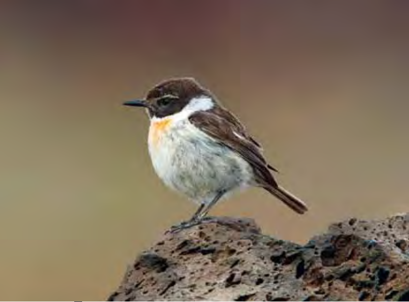
Macho adulto de tarabilla canaria o “caldereta” ( Saxicola dacotiae dacotiae ).