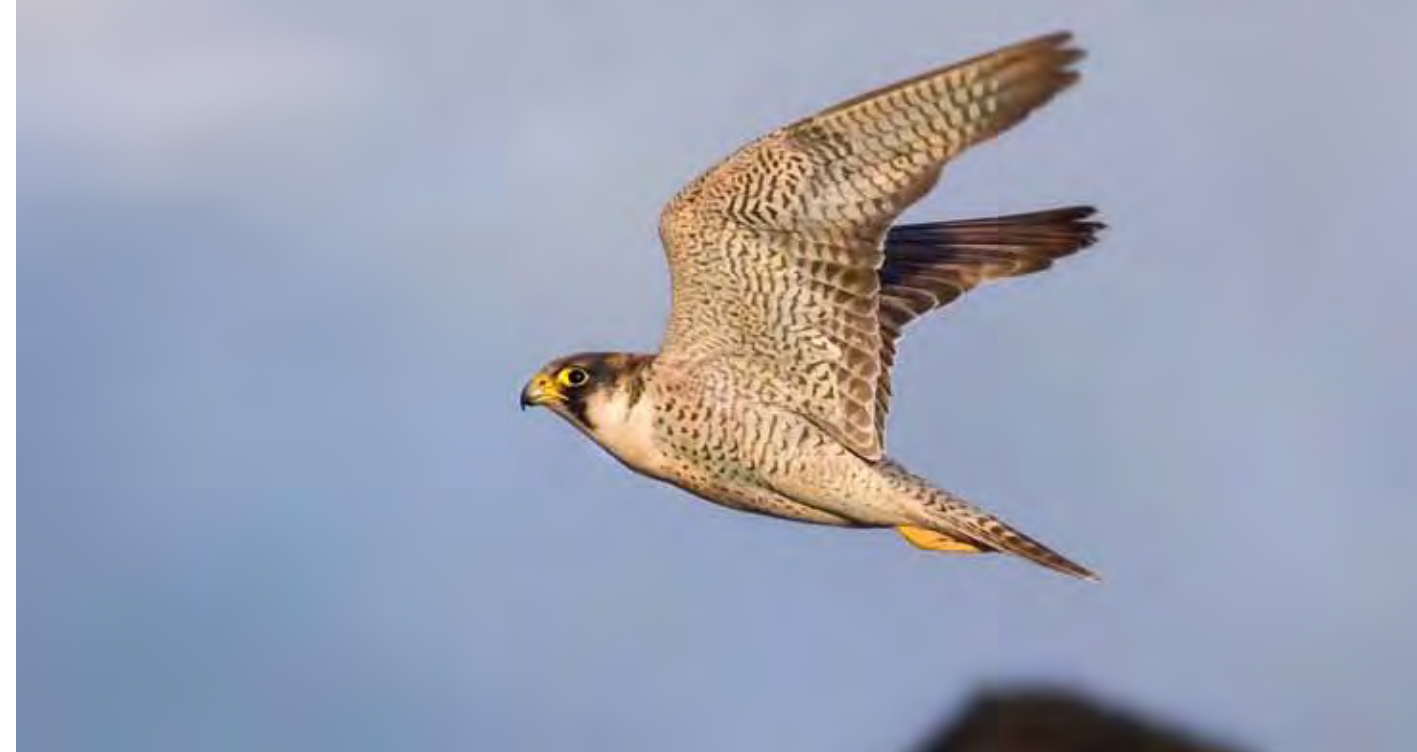
Halcón tagarote ( Falco peregrinoides ), especie en proceso de recuperación en las islas Canarias.

ja y en Lanzarote hay unas pocas aves que intentan nidificar sin éxito. Cría en cantiles costeros, barrancos y riscos del interior, así como en las laderas de ciertas montañas, y tiende a concentrarse en dormideros comunales. Entre los factores que amenazan su supervivencia se encuentran el impacto con los tendidos eléctricos, el plumbismo, la incidencia de los venenos y las molestias en sus áreas de cría, además de la modificación del hábitat debido a la creciente urbanización del territorio.