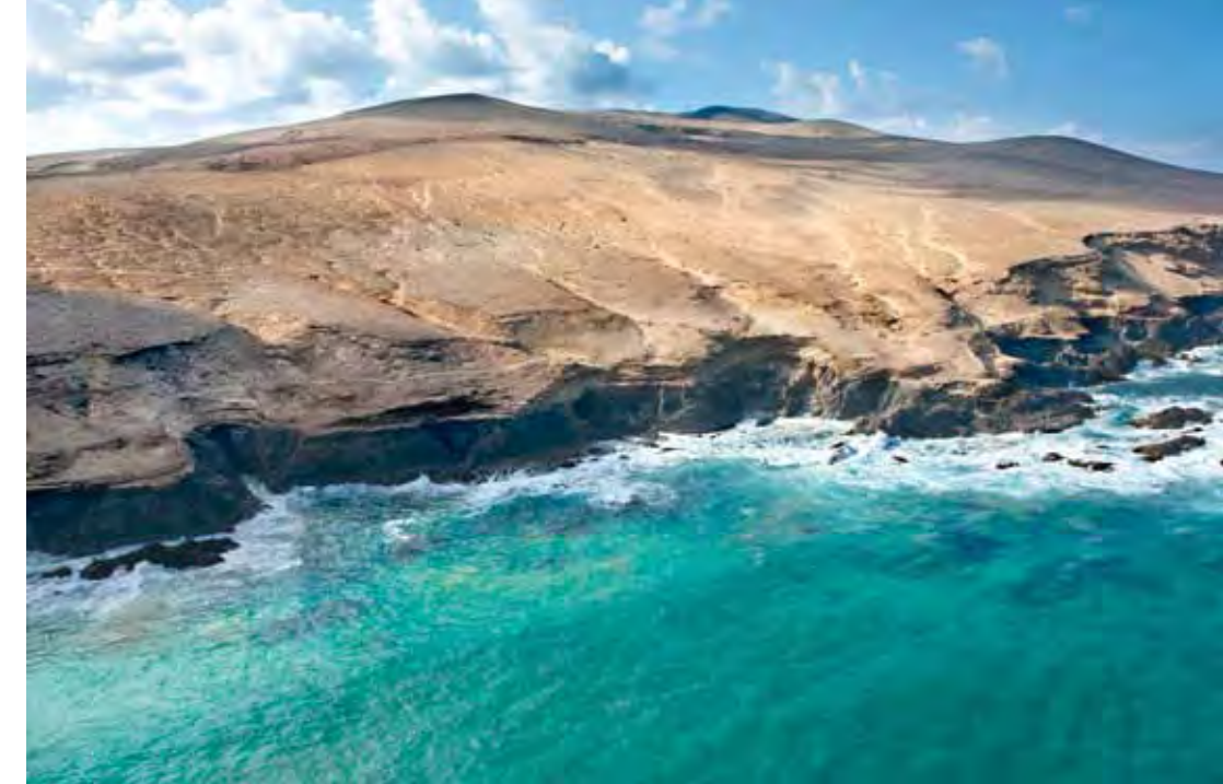
Las arenas del jable de Vigocho llegan hasta la costa.

Los terrenos se hallan orientados hacia el mar, presentando un relieve de modestas proporciones, con la cota más elevada en montaña Sicasumbre (523 m), siendo otros hitos destacables El Cantil (425 m), Gavioto (385 m), Morro Blanco de Amanay (351 m) y montaña de la Hendidura (309 m). Unas altitudes ampliamente rebasadas por los 694 m de la cercana montaña Cardones, al sureste del espacio pero ya fuera del campo militar, una de las mayores alturas de Fuerteventura. Sin embargo, visto desde el mar, su perfil es completamente diferente, muy abrupto, con acantilados de hasta 70 m de altura, que caen en gran pendiente sobre las desembocaduras de los barrancos, donde se ocultan pequeñas playas de callaos o de arena oscura.