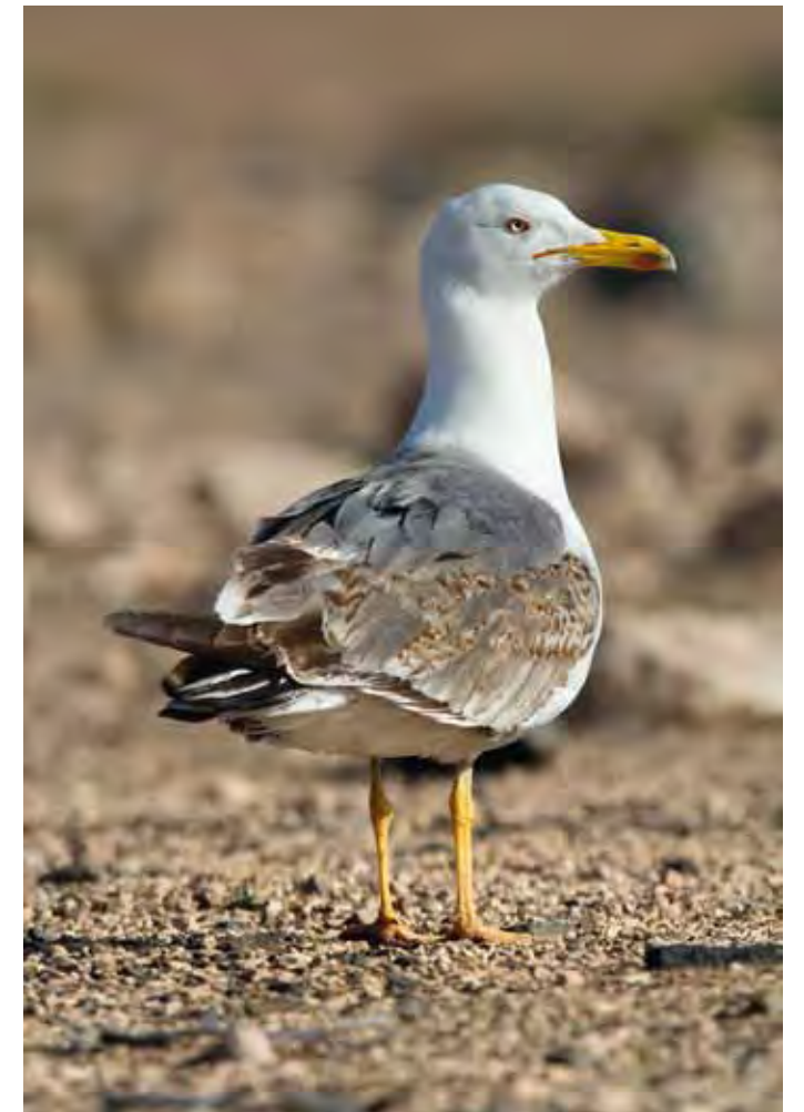
Ejemplar inmaduro de gaviota patiamarilla ( Larus michahellis atlantis ).

Las aves marinas, ya sean pelágicas o costeras, cuentan con la presencia confirmada de tres especies: pardela cenicienta ( Calonectris diomedea borealis ), gaviota patiamarilla ( Larus michahellis atlantis ) y gaviota sombría ( Larus fuscus graellsii ). También se ha señalado al petrel de Bulwer o "perrito" ( Bulweria bulwerii ) en la punta de Amanay, citándose incluso indicios de cría, aunque no existen datos confirmados al respecto. De todas ellas la más común en la zona es la gaviota patiamarilla, que cuenta con una amplia colonia de cría, la cual fue censada en la primavera de 1987 (165-175 parejas)