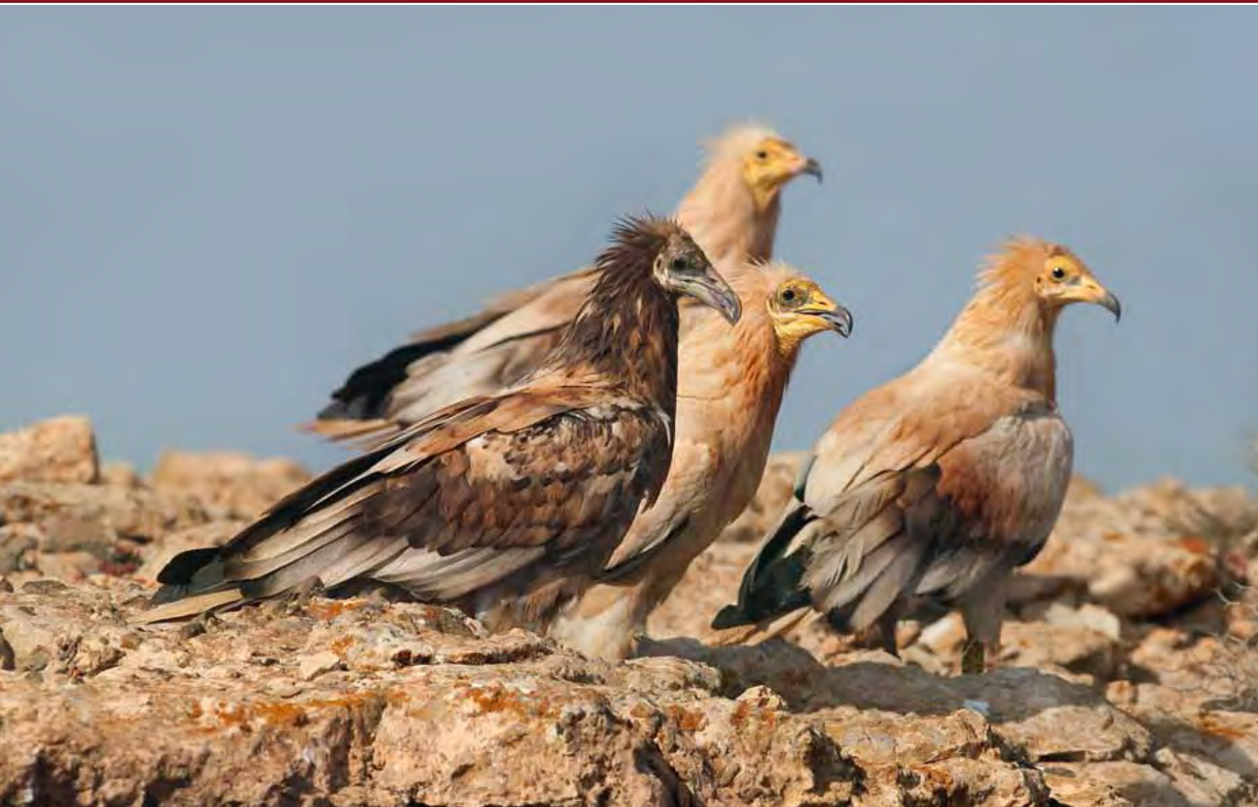
Alimoche común o “guirre” ( Neophron percnopterus majorensis ). Constituye la rapaz más amenazada de Canarias.