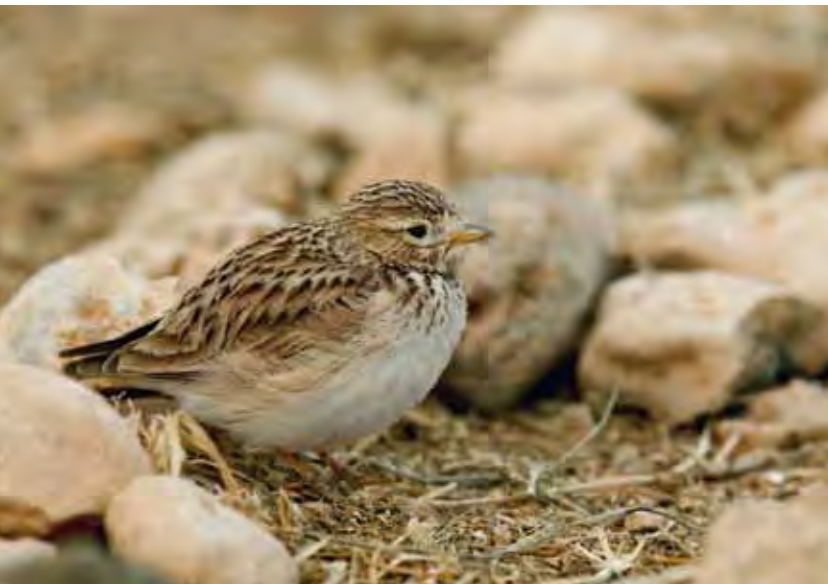
Terrera marismeña o "calandria" ( Calandrella rufescens polatzeki ).