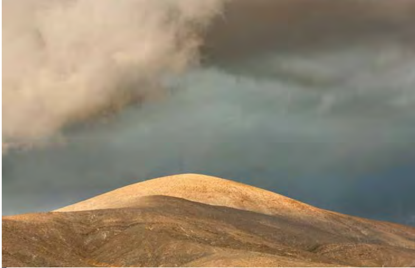
La erosión ha modelado un singular paisaje de suaves lomas en el viejo edificio del Complejo Basal.

actual isla de Fuerteventura. Surgido de la acumulación de sedimentos oceánicos, rocas plutónicas y lavas almohadilladas (volcano-submarinas), aparecen atravesados por una densa malla filoniana, en forma de diques intrusivos intensamente fracturados. Serían pues estas intrusiones magmáticas las que levantaron los viejos depósitos submarinos por encima del mar hace 20 millones de años, conformando el basamento inicial sobre el que se construyó la isla de Fuerteventura.