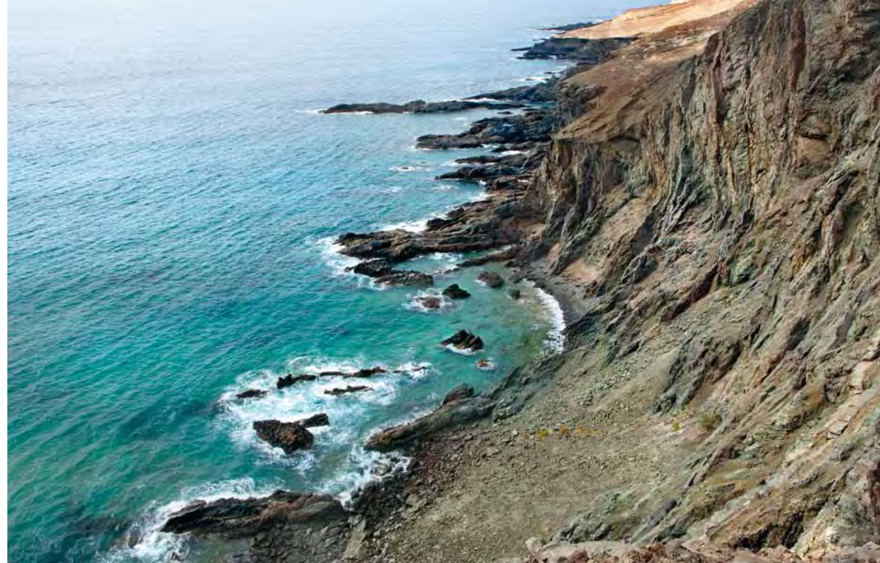
Cueva de Lobos, topónimo que alude a la antigua presencia de la foca monje o “lobo marino” en la zona.

También, y ya en lo referente al medio estrictamente terrestre, no puede descartarse que en el pasado existiera en esta zona la rata de malpaís ( Malpaisomys insularis ), un ro-