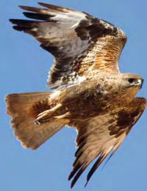
Busardo ratonero o "aguililla" ( Buteo buteo insularum ). Esta especie no cría dentro del campo militar de Pájara, pero lo visita ocasionalmente.

La relativa variedad de especies de vertebrados terrestres que ocupa la superficie catalogada como campo de tiro llega a ser hasta cierto punto sorprendente, teniendo en cuenta el carácter extremadamente árido del territorio, la escasa vegetación existente en buena parte del mismo y la ausencia de recursos hídricos, salvo en algunos tramos de ciertos barrancos que albergan un poco de agua en superficie, como Vigocho y Amanay. En definitiva, un panorama a priori poco favorable para el desarrollo de las comunidades de reptiles, aves y mamíferos, que contrasta con la realidad. Sumando nuestras propias observaciones, realizadas en su mayoría en-