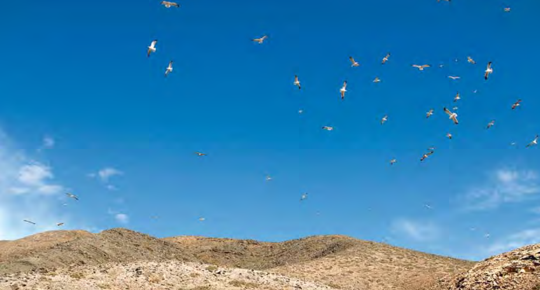
Colonia de cría de gaviota patiamarilla ( Larus michahellis atlantis ), situada en la zona de Amanay - Las Hendiduras.