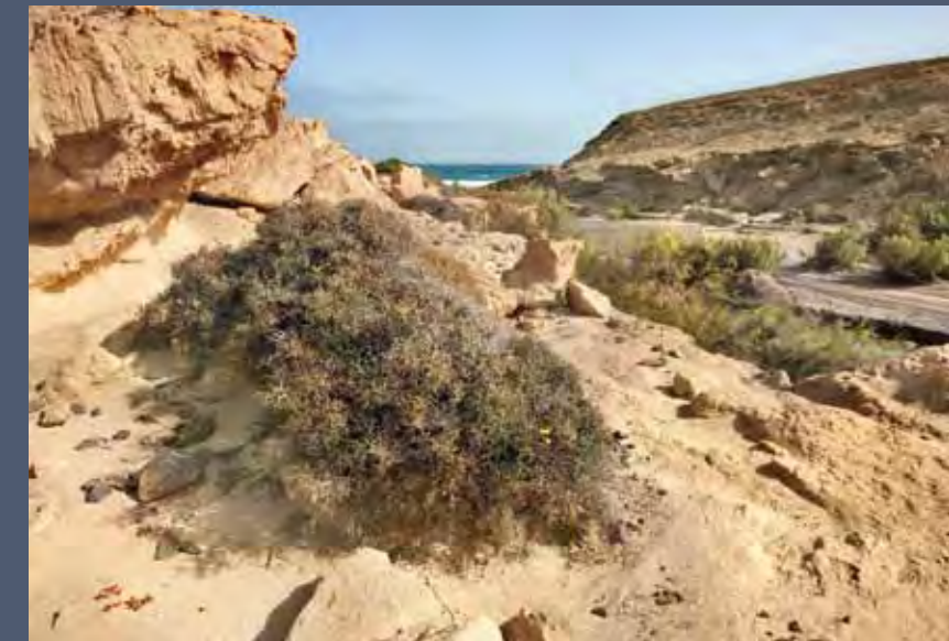
La aulaga ( Launaea arborescens ) es muy abundante en las Canarias orientales.

los límites del campo militar su mayor población conocida a nivel mundial.