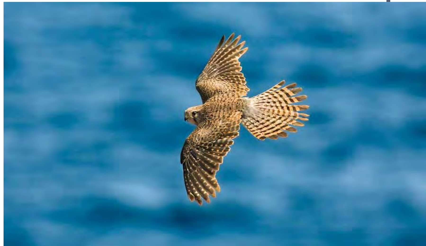
Cernícalo vulgar ( Falco tinnunculus dacotiae ).

Las rapaces nocturnas están representadas únicamente por la lechuza común o "coruja" ( Tyto alba gracilirostris ), que cuenta con una subespecie endémica de las islas e islotes orientales de Canarias, aunque dicha situación se debe clarificar aún mediante los oportunos estudios genéticos. La única información de que disponemos es la existencia, hacia principios de la presente década, de un posadero y posible nido localizado en una cavidad del barranco de Amanay, actualmente abandonado. De todas formas, esta especie podría estar presente aún en otros sectores del campo de tiro que no hemos podido prospectar.