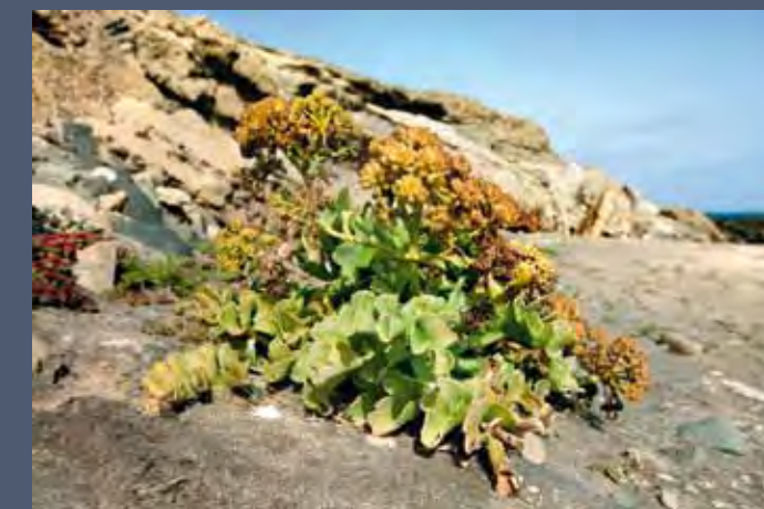
Ejemplar de lechuga de mar ( Astydamia latifolia ) en la playa cerca de la desembocadura del barranco de Vigocho.