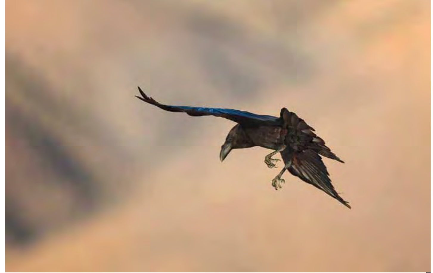
Cuervo ( Corvus corax canariensis ). Las poblaciones mayoreras de esta especie son las más importantes del archipiélago canario.

Otras aves insectívoras de pequeño tamaño son las dos currucas que crían en Fuerteventura, la tomillera ( Sylvia conspicillata orbitalis ), denominada localmente "chislero", "marruecos chico" y "mosquita", y la cabecinegra ( Sylvia melanocephala leucogastra ), llamada "chislero" y "rueca". Seleccionan hábitats netamente distintos, ya que la cabecinegra muestra una preferencia muy marcada por los bosquetes de tarajales, mientras que la tomillera puede ocupar sitios mucho más abiertos, siempre que éstos tengan una adecuada cobertura arbustiva y herbácea. Curiosamente, dentro del campo de tiro parece ser más común la primera. Los enclaves en los que se han detectado cabecinegras han