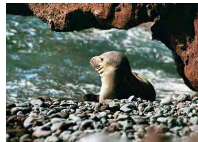
Foca monje ( Monachus monachus ) fotografiada en las islas Desertas (Madeira).

Por último, no puede descartarse la existencia en el pasado de la pardela de jable ( Puffinus holeae ) en los arenales de Vigocho, aunque de momento no se conoce ningún yacimiento paleontológico de esta especie en el enclave. De dicha pardela se han encontrado en cambio abundantes restos óseos y huevos fosilizados en el jable del istmo de La Pared, de ahí su nombre, ya que prefería los sustratos arenosos para nidificar, frente a otra pardela ya extinta, la de malpaís ( Puffinus olsoni ), que vivió con certeza hasta la época prehistórica y criaba en áreas de “malpaís” o coladas lávicas. Esta última especie era endémica de Canarias, y más concretamente de las islas e islotes orientales.