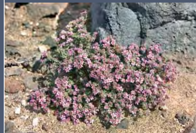
La bella floración de la mata parda o tomillo marino ( Frankenia capitata ) destaca en el árido paisaje.

En los tramos de costa arenosa, escasos en el campo militar, la situación varía ligeramente. Su vegetación es muy similar a la de las áreas arenosas descrita en el apartado siguiente, pero se ve enriquecida localmente por especies típicamente halófilas como la siempreviva zigzag ( Limonium papillatum ) y el moqueguirre ( Senecio leucanthemifolius var. falcifolius ), un endemismo canario-oriental. Ambas plantas se encuentran en la parte suroccidental del jable de Vigocho, teniendo la segunda de ellas aquí sus mejores poblaciones en Fuerteventura. Al sur de la desembocadura del barranco de Vigocho, ligeramente fuera del campo militar, también se ha detectado una población de la servilleta o lechuga de mar ( Astydamia latifolia ), planta halófila común en las costas de las islas centrales y occidentales de Canarias, pero bastante escasa en Fuerteventura. En este enclave está acompañada, entre otras especies, por la siempreviva zig-zag.