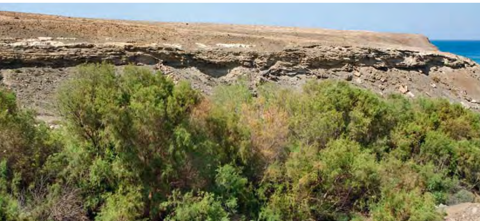
Bosquetes de tarajal en el fondo de un barranco.

abiertos y bien iluminados, puede llegar a formar densos céspedes que se consideran una asociación vegetal propia llamada Cyperetum laevigati .