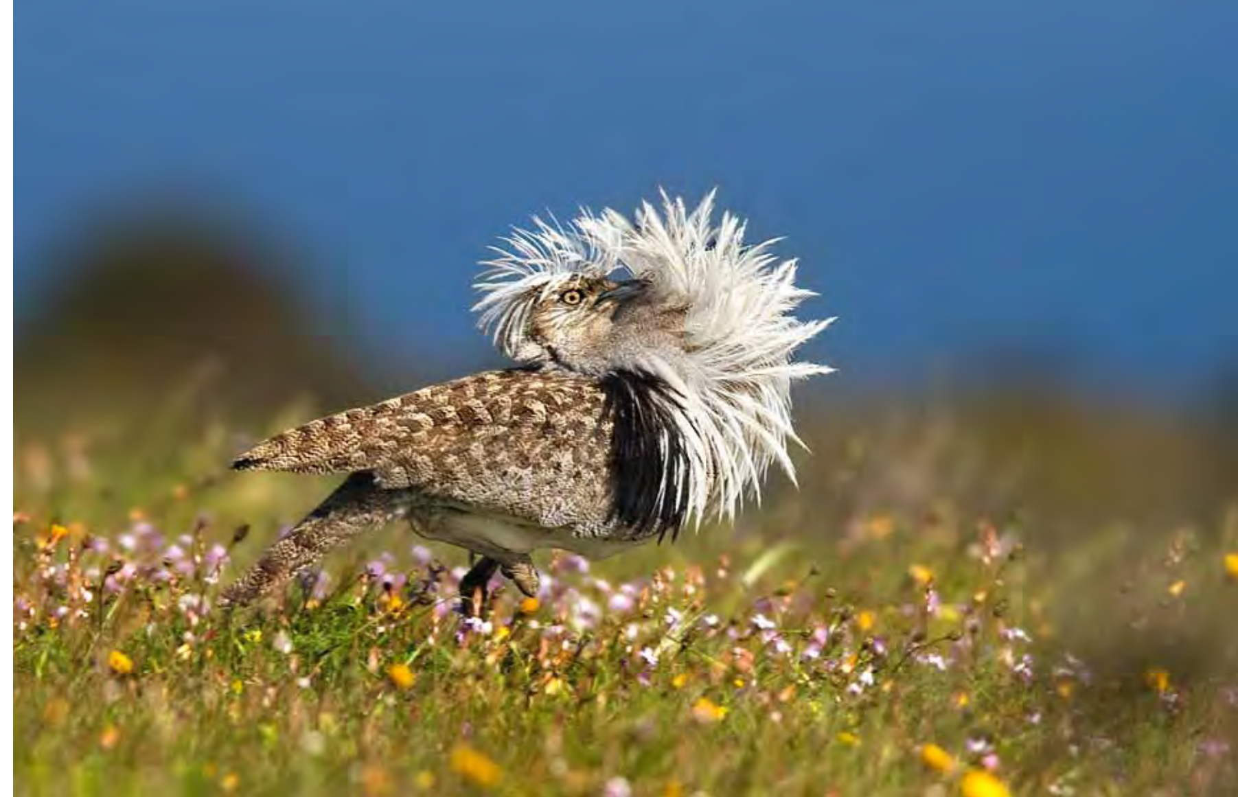
Macho de avutarda hubara ( Chlamydotis undulata fuertaventurae ) en pleno cortejo.

El sigiloso alcaraván común o "pedro luis" ( Burhinus oedicnemus insularum ) es una de las aves más enigmáticas