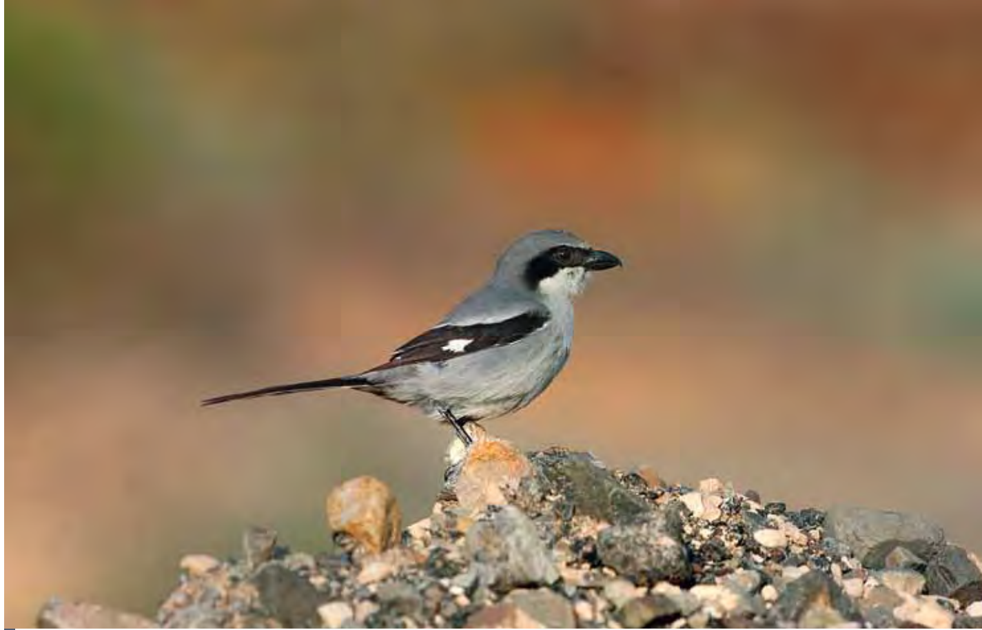
Alcaudón real o "alcairón" ( Lanius meridionalis koenigi ).

las paredes de barrancos y los acantilados costeros como en el interior de pozos abandonados, sorprendiendo la localización de varios nidos ocupados en estos últimos en fechas tan tempranas como el mes de febrero. En lo que respecta a la tórtola, se halla especialmente ligada a los "bosquetes-galería" de tarajales ( Tamarix canariensis ) existentes en determinados barrancos, como el de Vigocho, pero no parece ser muy frecuente. Esta ave está ausente en las islas a partir de finales de verano y principios de otoño, para regresar de tierras africanas una vez finalizado el invierno.