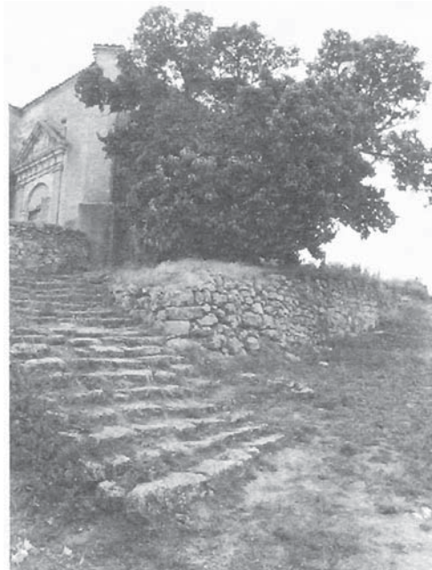
Moral con casi 1.000 años de Villoviado, nacido de la sangre de San Vitores