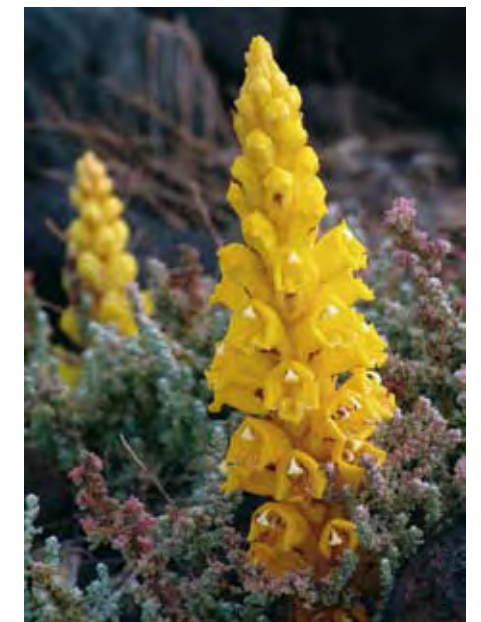
De izquierda a derecha y de arriba a abajo: Limonium tuberculatum . Limonium ovalifolium subsp. canariense . Limonium papillatum . Cistanche phelipaea .