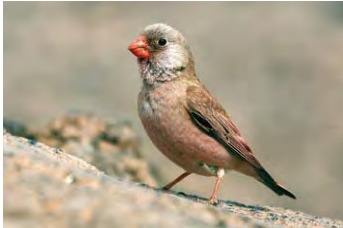
De izquierda a derecha y de arriba a abajo: El vuelvepedras es una de las aves no nidificantes que pueden verse con más frecuencia. El petrel de Bulwer mantiene una pequeña colonia. Bisbita caminero. Ejemplar macho de camachuelo trompetero durante la época de cría. Página derecha: Arriba: Izquierda: Paíño de Madeira. Derecha: Pardela cenicienta sobre una tabaiba dulce. Abajo: Izquierda: Pardela cenicienta incubando. Derecha: Pollo de pardela en su hura.

quedan un momento a pocos metros de nosotros para luego emprender un torpe andar hacia la hura, en la que el pollo espera el alimento. Otras salen y tratan de levantar el vuelo. Todo esto en medio del ruido de sus gritos y el olor a amoníaco que sale de las huras. –“A ver, ésta”. No sin esfuerzo atrapamos a la primera. Se retuerce, trata de aletear y de picar. Vemos que ya tiene anilla, que nos dice que nació en las islas Salvajes hace dos años. La soltamos. Aquí, otra. El anillamiento dura poco y una vez libres de nuevo, parece que olvidan rápidamente la experiencia y vuelven a sus ocupaciones de cría. Se estima que un millar de parejas nidifican actualmente en Lobos, aproximadamente un 3 % de las que anidan en Canarias. Pasan el invierno en alta mar, recorriendo todo el Atlántico desde las costas de Brasil hasta la lejana Namibia,