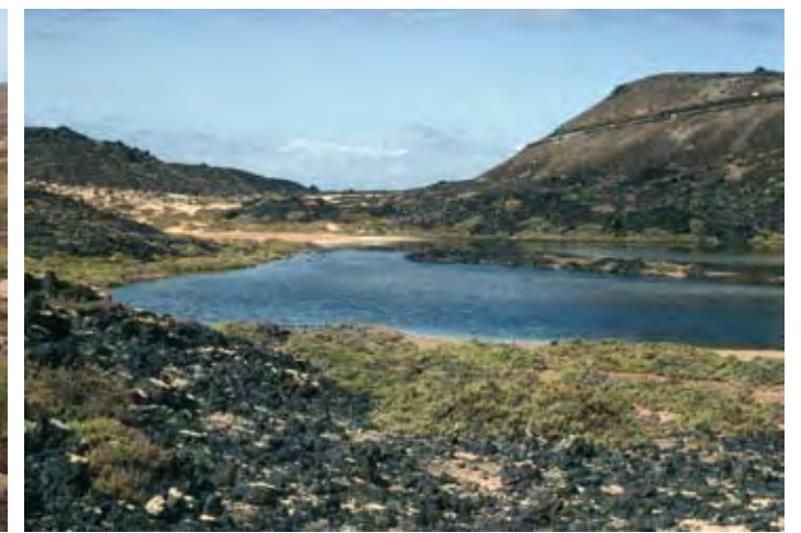
Página izquierda: De izquierda a derecha y de arriba a abajo, Suaeda vera. Euphorbia regis-jubae. Euphorbia balsamifera. Polycarpaea nivea. Limonium tuberculatum. Limonium ovalifolium subsp. canariense. En esta página: Arriba: Izquierda: Tabaibal dulce sobre escorias lávicas. Derecha: Comunidad de Limonium ovalifolium subsp. canariense en el saladar de Las Lagunillas. Centro: Izquierda: Comunidad de Limonium tuberculatum en el mismo saladar. Derecha: Cerca del faro existe otra pequeña laguna de interés para la observación de aves migratorias. Abajo: La tabaiba amarga también forma parte de la vegetación suculenta de Lobos.

y numerosas en Fuerteventura y Lanzarote, en Lobos pierden protagonismo a favor de especies más halófilas como Sal-sola tetrandra o Suaeda ifniensis . Al sur de Las Lagunillas crecen algunos ejemplares de mato gota ( Atriplex halimus ), y en los arenales vemos las pequeñas y compactas matas de la lengua de pájaro ( Polycarpaea nivea ), con sus hojas cubiertas de denso tomento gris plateado que las protege del sol. También es frecuente la matilla parda o tomillo marino ( Frankenia capitata ), con vistosa floración rosado-violeta en primavera. Es posible que desembarcaran en Lobos algunos de los naturalistas que estuvieron en Canarias en la segunda mitad del siglo XIX, como Oscar Simonyi y Carl Bolle, y en la primera mitad del XX, como Oscar Burchard. En los escritos