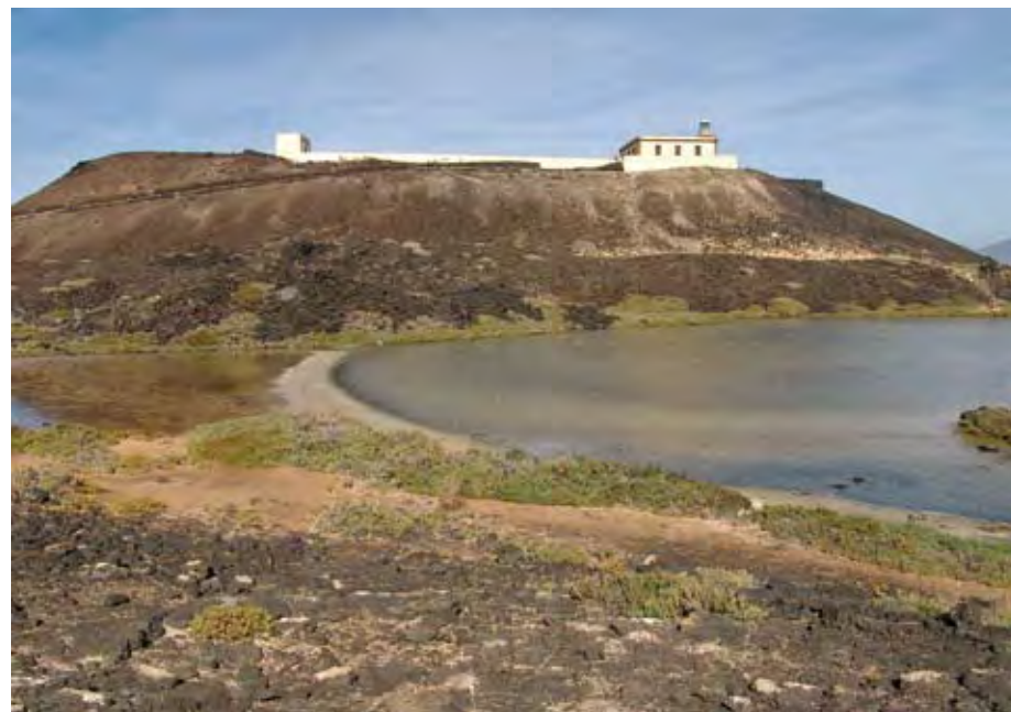
En esta página: Arriba: El interior está salpicado de hornitos de lava oscura. Abajo: El faro de Martiño se levanta sobre un antiguo cono volcánico.

de Corralejo. No en su integridad, pues 3 enteros y 667 milésimas por ciento siguieron en manos de los herederos de Luis de Queralta y López. Por otra parte, se instalaron esporádicamente en Lobos los legionarios del Tercer Tercio de la Legión Española. Constituidos en guarnición en Fuerteventura tras la descolonización del Sahara en 1975, utilizaron en numerosas ocasiones el islote como peculiar campo de maniobras. El peligro de la urbanización no fue atajado hasta que Lobos pasó a formar parte de la Red Canaria de Espacios Naturales Protegidos, primero, en 1982, en un espacio conjunto con las dunas de Corralejo, y luego, en 1994, de forma independiente. Tiene la categoría de Parque Natural. En el año 2003 fue adquirido junto con los dos grandes hoteles de la costa de Corralejo antes mencionados por la cadena hotelera RIU, llegándose finalmente, en mayo de 2007, a la última etapa del largo camino marcado por frecuentes cambios en la titularidad, hasta entonces siempre privada, del islote: a cambio de ampliar la licencia de los dos polémicos hoteles de Corralejo, la empresa RIU cedió la propiedad al Ministerio de Medio Ambiente de España, que de esta manera es en la actualidad el dueño de la mayor parte del islote. Sin duda, ello deberá repercutir favorablemente en la capacidad de tomar decisiones a favor de la protección y correcta gestión de