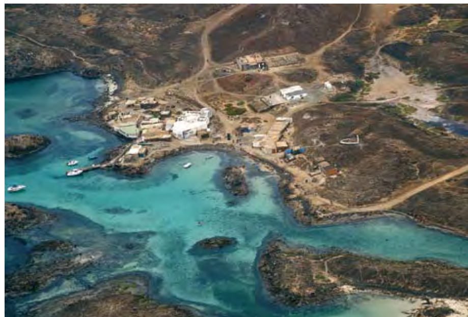
Arriba: Ensenada de Lobos con el puertito al fondo, uno de los tradicionales lugares de refugio de los pescadores majoreros. Abajo: Izquierda: Vista aérea del mismo asentamiento. Derecha: Extremo nororiental donde se ubica el faro. Página derecha: Arriba: Plantación abandonada de henequén. Abajo: Vista del islote desde la costa de Corralejo.

Desde luego, rumores no faltaron. Se habló de un médico de Cataluña que quería hacer un hotel en lo alto de La Caldera. De que el cantante Frank Sinatra estuvo a punto de adquirir la isla por medio de una compañía norteamericana